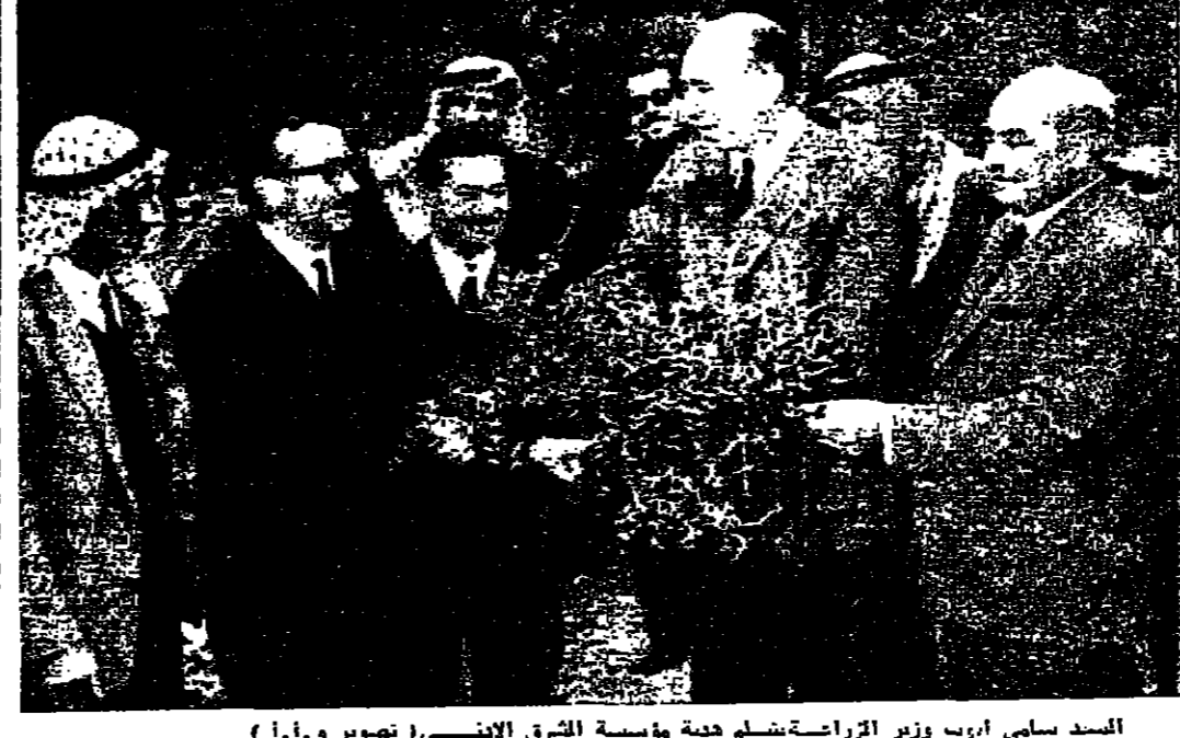
السيد سلمي ايوب وزير الزراعة يتسلم هدية مؤسسة الشرق الاثني (تصوير ١.١.٥)

مؤسسة لشراء اراضي تسلم بناية مركزه تدبير لرشيد زراعيين لوزارة وقرر السيد ايوب ان الوزارة منوطة توزيع الفراس على الفزارعين المقتضين بمسارح الشجر . املنا ان يلقى الفراس المستحق الحظ فيستولي الوزارة برعايته على نخلي واسع لخيايت نجارية واقصايب . وقال الوزير ان تقديم هذه الكميات من الفراس من مؤسسة الشرق الاثني الى وزارة الزراعة يعتبر دعما للفقراء القائم بين الوزارة والمؤسسة ، وقد قامت المؤسسة بالتعاون مع وزارة الزراعة بشراء ثلاثين الف دونم من غراس التوت والينون بالإضافة الى خدماتها في حقل القطن الاصطناعي للزراعة وتحسين تربية الماعز والقمل . ومن جهة اخرى ذكر السيد ايوب ان الوزارة تقوم بالتعاون مع وزارة الزراعة بدراسة امكانية استصلاح عشرة الاف دونم من الارض في منطقة الشرق واليونان وتعتبر تلك الارض الوطنية والزراعة وتعتبر تلك الارض الشرق نصف مليون دينار . وقال السيد ايوب ان المؤسسة سقوم بتسلم بناية مركز تدريس غراس التوت والينون بالإضافة الى خدماتها في حقل القطن الاصطناعي للزراعة وتحسين تربية الماعز والقمل . ومن جهة اخرى ذكر السيد ايوب ان الوزارة تقوم بالتعاون مع وزارة الزراعة بدراسة امكانية استصلاح عشرة الاف دونم من الارض في منطقة الشرق واليونان وتعتبر تلك الارض الوطنية والزراعة وتعتبر تلك الارض الشرق نصف مليون دينار . وقال السيد ايوب ان المؤسسة سقوم بتسلم بناية مركز تدريس